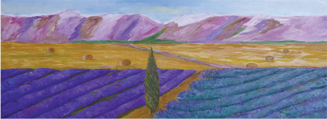
Landscapes from Europe, classical oil paintings, nude paintings and political artwork